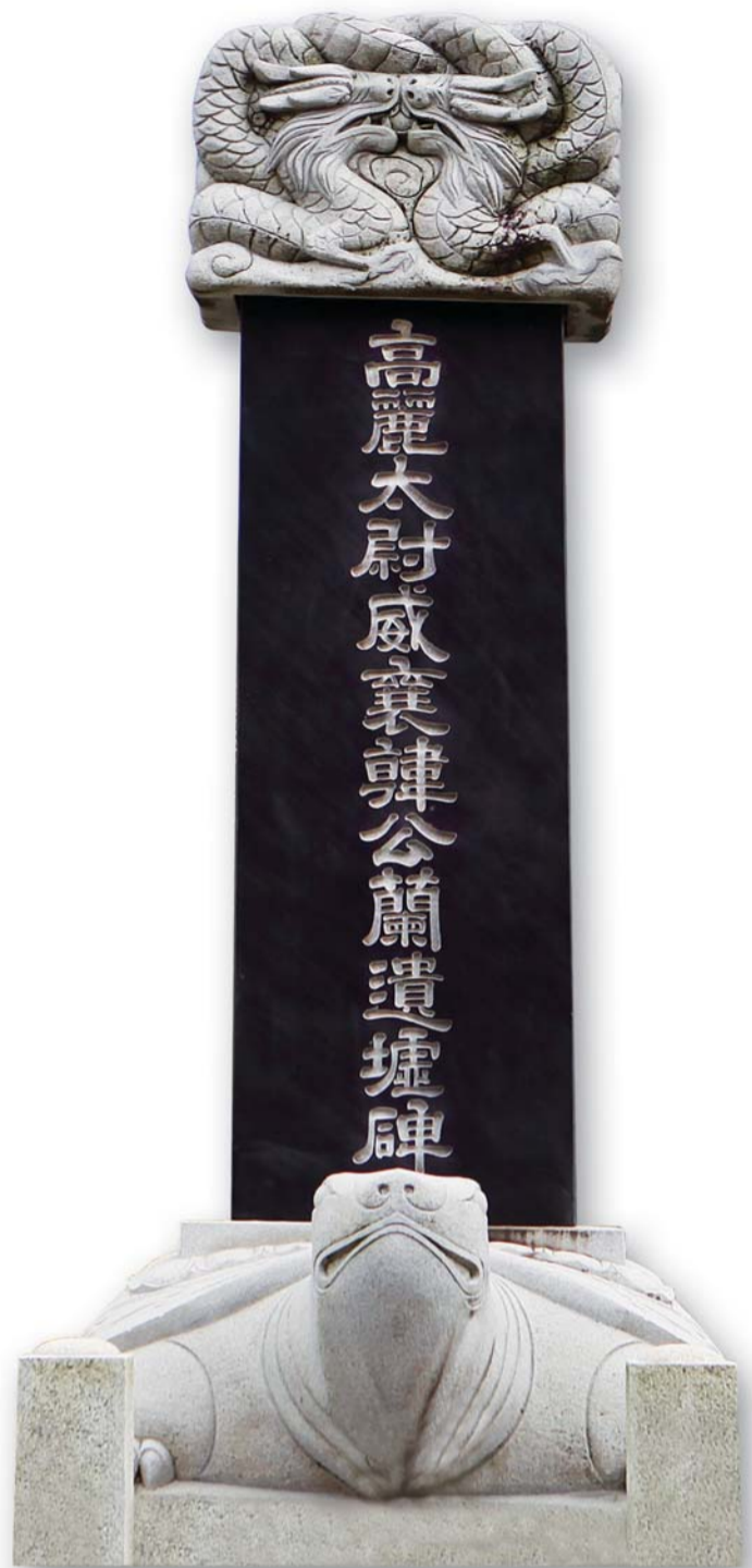
유허비遺墟碑 시조 위양공의 유업을 기리기 위해 1986년 10월 시조탄생유지로 들어가는 도로 초입에 세워졌다.