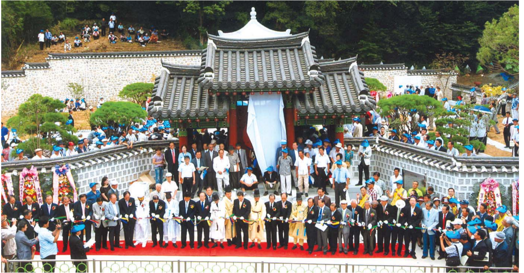
淸韓閣 준공식은 삼문 앞에서 테이프 커팅으로 시작되었다.