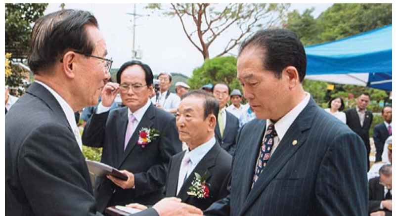
오른쪽부터 광전 경기도종친회장, 영교 전북종친회장, 희섭 대구·경북종친회장