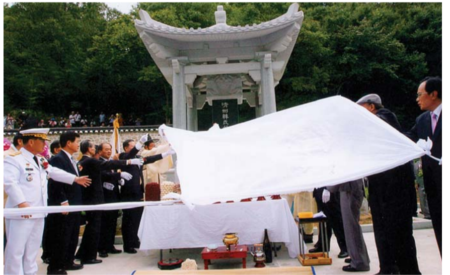
시조 위양공의 사적이 기록된 기적비 제막