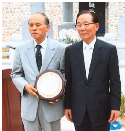
원교 사진작가 (왼쪽)