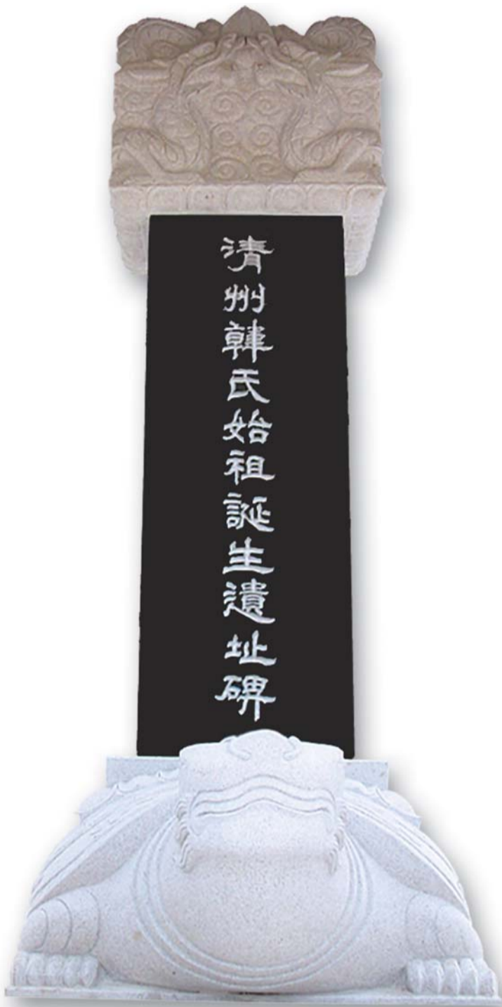
기적비紀蹟碑 시조 위양공의 사적史蹟을 적어 후세에 전하기 위해 공께서 탄생한 집터인 청한각 중앙에 세워진 석비石碑이다. 비문은 후손 甲洙중앙회장이 짓고 비는 후손 陽命추진위원장이 세웠다.