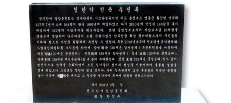
추진록비推進錄碑 시조탄생유지지역화사업 추진경위와 주민들의 협조 및 추진위원회 집행부회장단의 헌성금 모금에 기여한 공로를 치하하는 내용이 새겨져 있다.