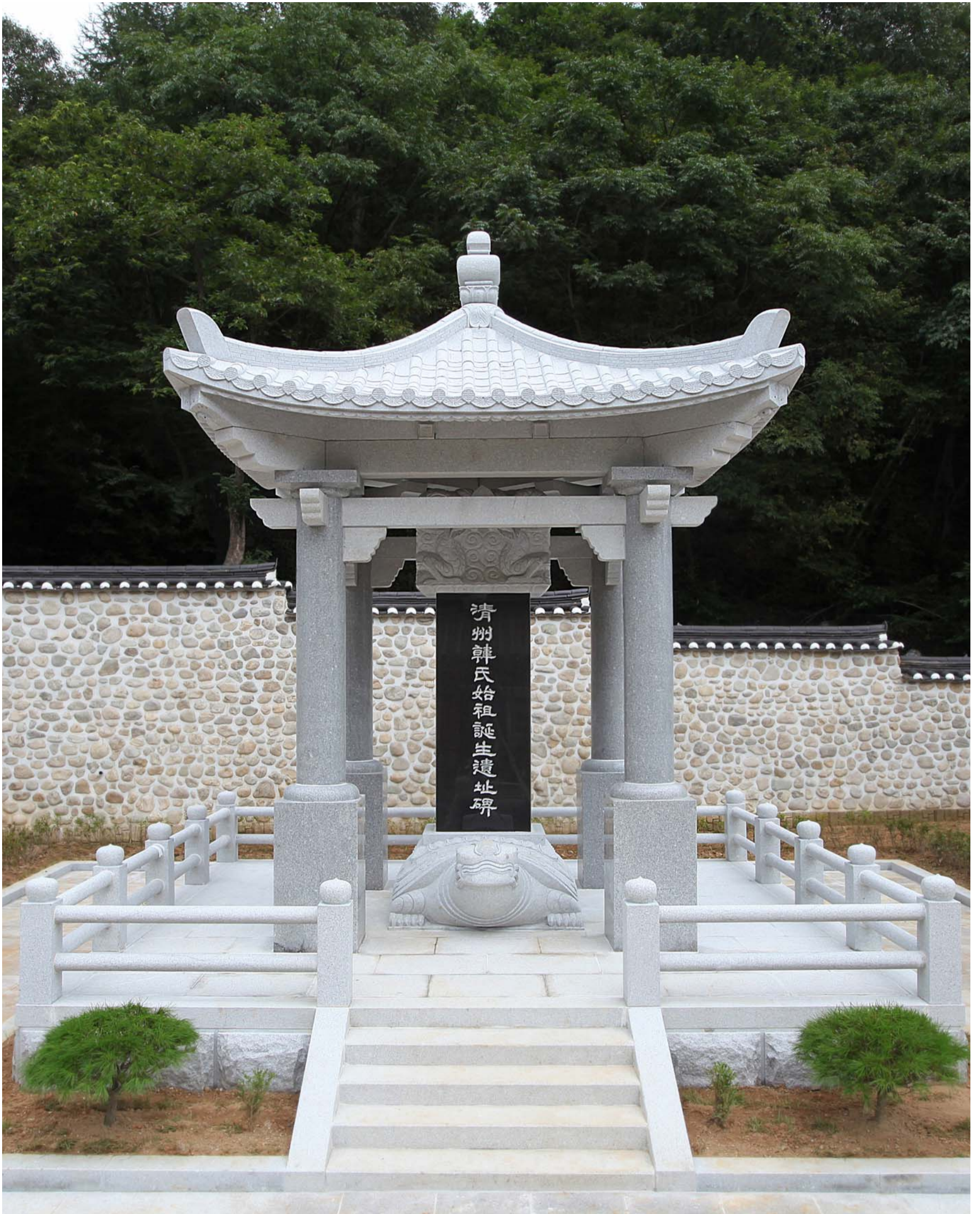
석비각石碑閣 기적비紀蹟碑를 보호하기 위한 비각碑閣으로 주변환경과 미적美的인 조화를 이루기 위해 네 기둥과 기와를 얹은 모양으로 지붕을 아름답게 조각한 가첨석加檐石 전부를 우아優雅한 화강석으로 웅장하게 건축하였다.