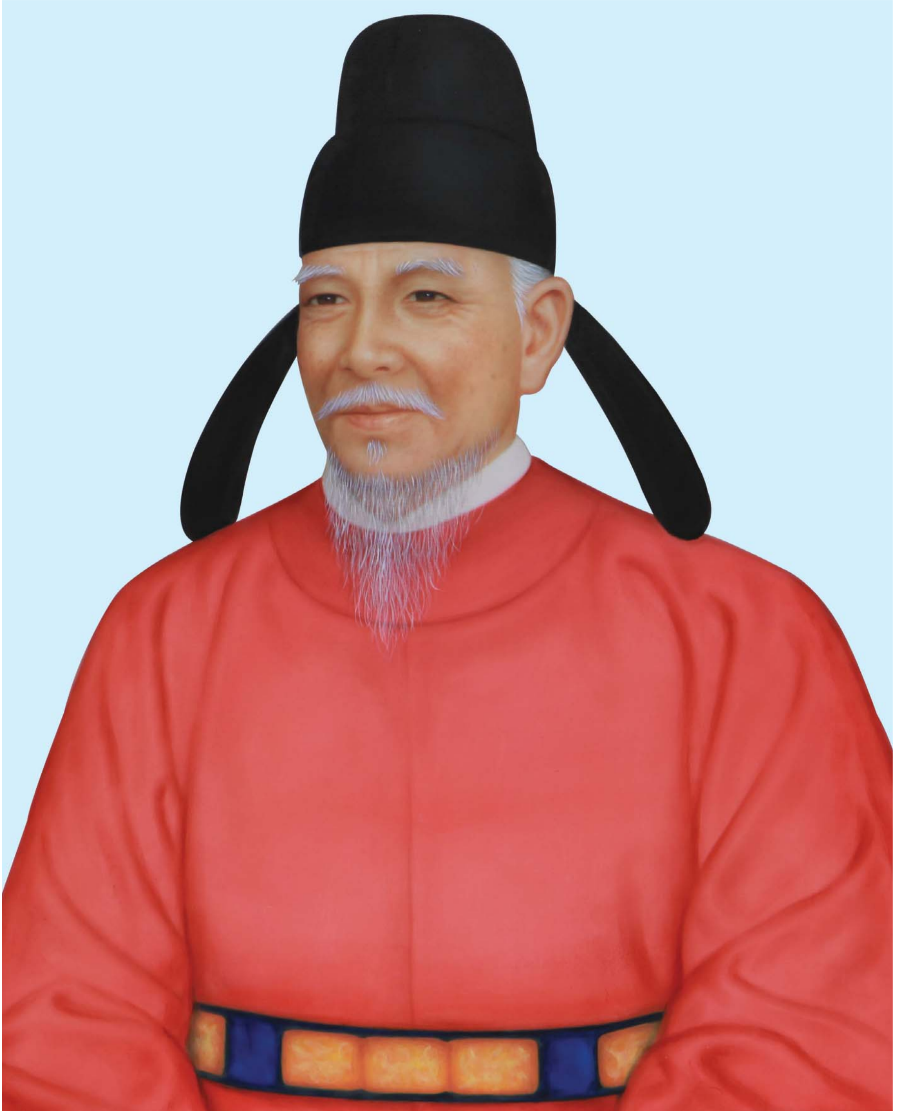
시조 위양공威襄公의 영정影幀