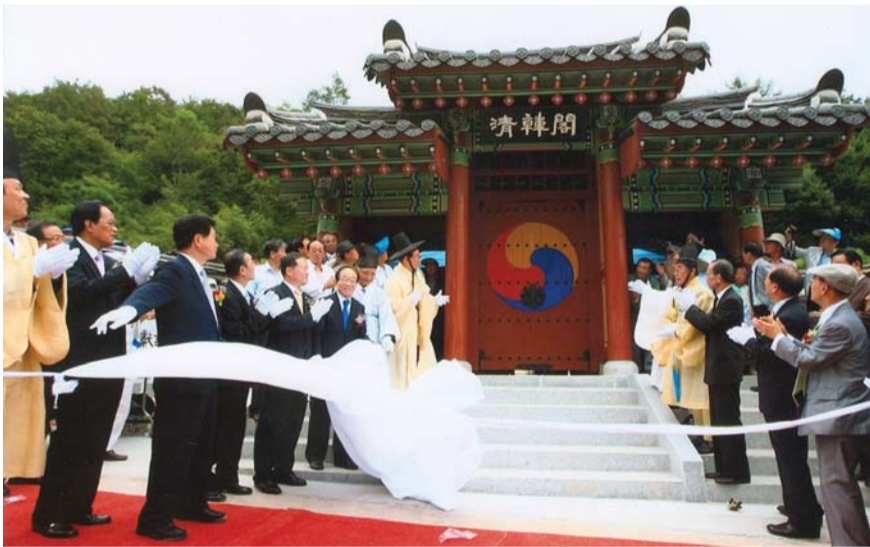
삼문에 부착된 淸韓閣 현판 제막