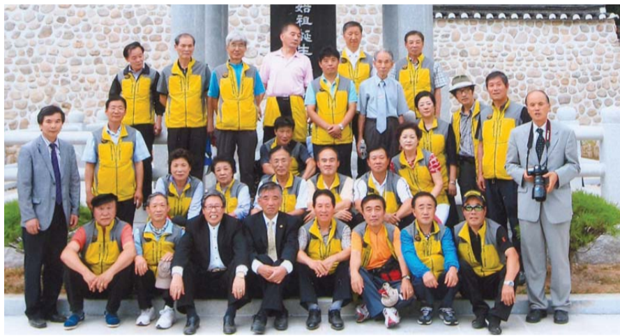
준공식 봉사활동을 마친 서울청장년회원들

중년에 청주시 방서동으로 이주하여 방정(方井)을 파서 용수로 쓰고 뒷산마루에 무농정(務農亭)을 지어 향학(鄉學)을 일으키는 한편 황무지를 개간하고 농사를 권장하면서 부농(富農)을 이루었다. 때 마침 후백제의 시조 견훤(甄萱)을 정벌하기 위해 청주를 통과하던 고려 태조 왕건의 고려군에게 군량미를 제공하고 종군까지 하여 큰 공훈을 세워 삼한벽상 공신에 녹훈되고 삼중대광문하태위의 벼슬에까지 올랐다.