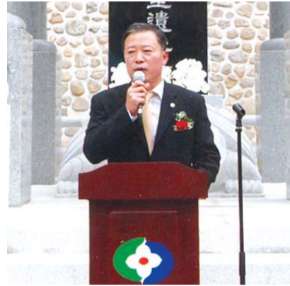
축사를 대독하는 박경국 부지사

우리 158만 충북도민의 사랑이자 우리나라 제일의 명문가로 칭송을 받고 있는 청주한문의 시조 위양공의 탄생지에서 그분의 훌륭한 뜻을 기리는 淸韓閣 준공식을 갖게 된 것을 매우 뜻 깊게 생각합니다. 아울러 이렇게 선조님들의 뿌리를 간직하여 후손들의 귀감으로 삼고자 하시는 韓甲洙중앙종친회장님의 노고에 깊이 감사를 드립니다. 특히 오늘의 청주한문을 존경받는 최고의 명문가로 만들어주신 한명숙, 한승수, 한덕수 전 국무총리님과 한승헌 전 감사원장님 등 덕망과 인품을 겸비하신 훌륭한 문중 어른신들과 종친회원들이 많이 참석해