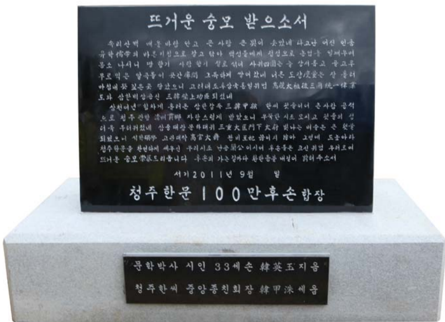
송시비頌詩碑 100만 후손들의 합장(合掌)으로 시조에게 뜨거운 승모(崇慕)를 드리는 송시(頌詩)를 새긴 비석으로 기적비의 오른쪽 앞쪽에 세워져 있다.