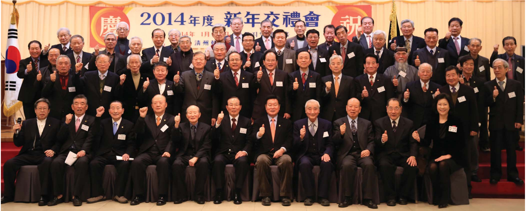
2014년 신년교례회에서 화이팅을 외치며 새해의 힘찬 출발을 다짐하고 있는 임원들

중앙종친회(회장 甲洙)는 지난 1월 15일 오전 11시 서울 용산 소재 전쟁기념관 역내 뮤지엄웨딩홀에서 70여명의 임원들과 일가들이 참석한 가운데 2014년 갑오년 새해의 활기찬 출발과 송조돈목의 화합을 다지는 신년교례회를 가졌다.