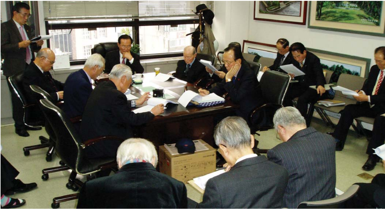
지난해 12월 30일에 개최된 인터넷대동족보 편찬위원회 전체회의

중앙총친회(회장 甲洙)는 지난해 12월 30일 오후 2시 중앙회 회의실에서 인터넷대동족보편찬위원회 전체회의를 열고 예빈윤공의 世系序次에 대해 6교에 기재된 7세를 9세로 환원키로 한 2011년 12월 15일의 정기총회 결의를 재확인하는 한편 앞으로는 이 정기총회 결의대로 인터넷대동족보를 구축해 나가기로 했으며, 따라서 예빈윤공 종중은 이 결의를 수용하지 않는 한 인터넷대동족보에 등재될 수 없게 된다.