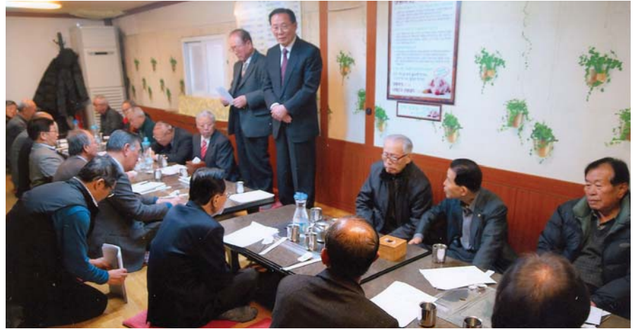
서원군파 회장단 회의에서 현안문제들을 논의하고 있다