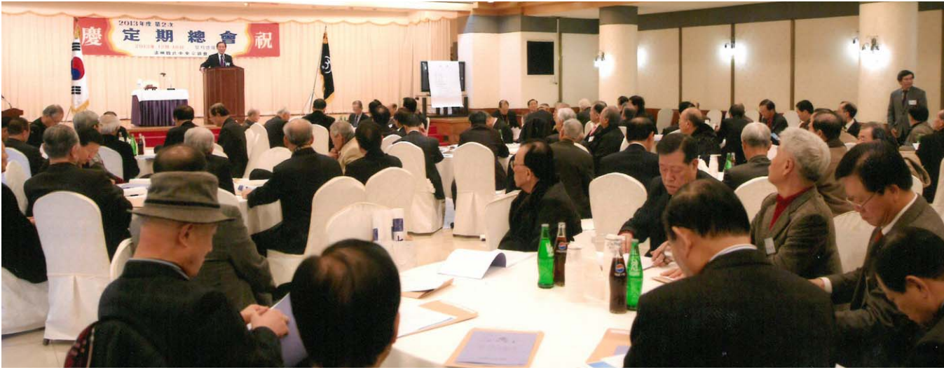
2013년도 정기총회가 12월 18일 전쟁기념관 역내 뮤지엄웨딩홀에서 개최됐다.