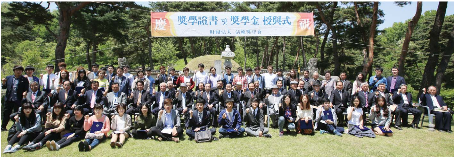
시조묘 앞에서 장학증서 수여식을 거행한 임원들과 장학생들이 청주한문의 역군이 될 것을 다짐하면서 기념촬영을 하고 있다.