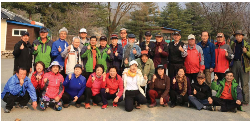
시산제 후 기념촬영

청한산악회는 지난 3월 23일 회원 35명이 참여한 가운데 강원도 기념물 제8호로 지정된 고석정에서 2014년도 안전산행을 기원하는 시산제를 겸한 3월의 정기산행을 실시하였다.