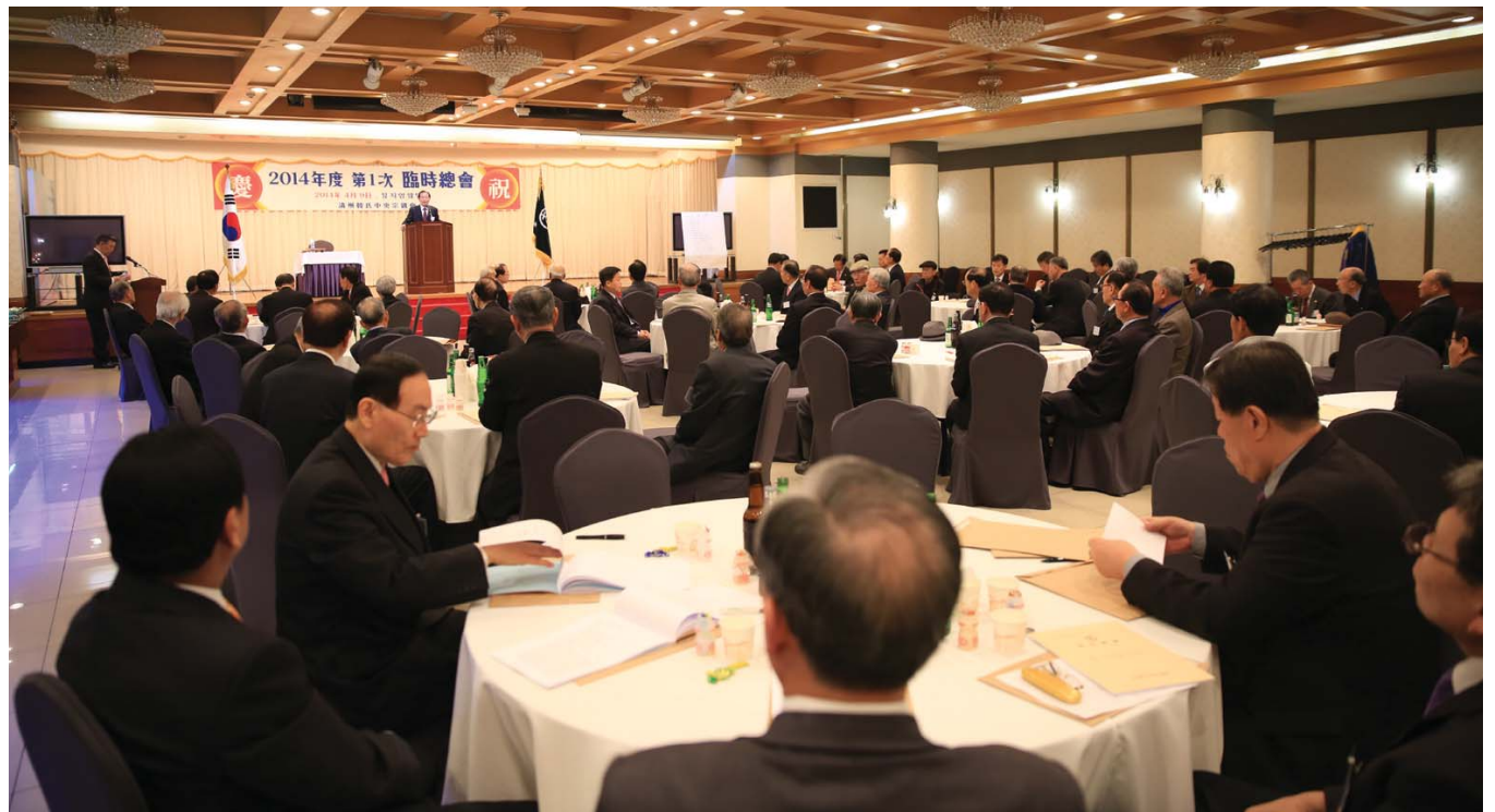
2014년도 제1차 중앙종친회 임시총회

입세출 결산(안)을 원안대로 가결한 후 인터넷족보 구축사업 추진현황과 제7교 대동족보 편찬사업 추진에 대한 보고에 이어 예빈윤공(휘 연)의 서차에 대한 종합검토 내용도 보고하였다. (관련 기사 2면)