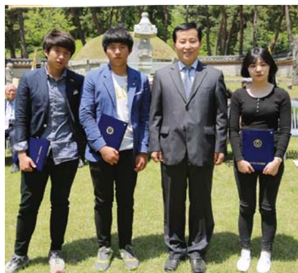
澤 상언공단위장학회장(대행 상언 교수)