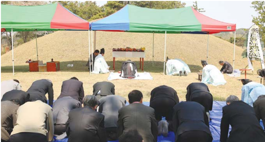
청주한씨 후손들이 무강왕 춘향대제를 봉행하고 있다.