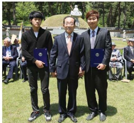
明珠 교위공단위장학회장(대행 현수 전 이사장)