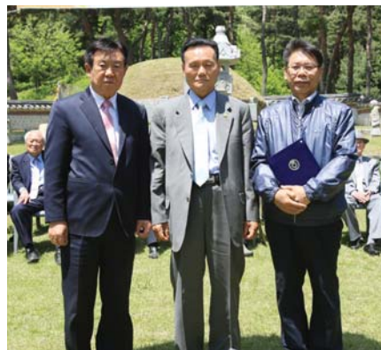
五作 상훈공단위장학회장 (대행 동경부산시회장)