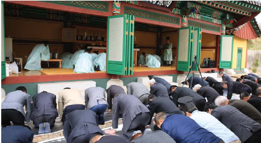
서원사에서 서원군 시제를 봉행하고 있다.

10세조 서원군(西原君, 諱 方信)의 2014년도 갑오년 시제가 지난 4월 12일(음력 3월 13일) 경기도 양주시 장흥면 삼상리소재 서원사(西原祠)에서 서원군과 吉洙회장을 비롯하여 많은 종현들이 참석한 가운데 엄숙하게 봉행되었다.