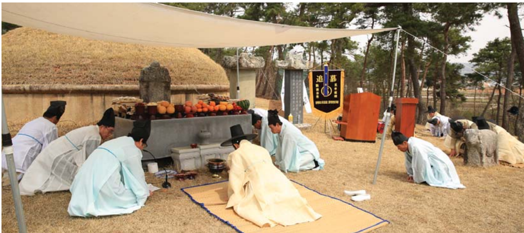
6세조 예빈경부군 묘소에서 시향을 봉행하는 후손들

6세조 예빈경부군 3월 31일 추원재에서 7세조 문혜공부군 4월 1일 모원재에서 8세조 제학공부군 4월 2일 봉강재에서